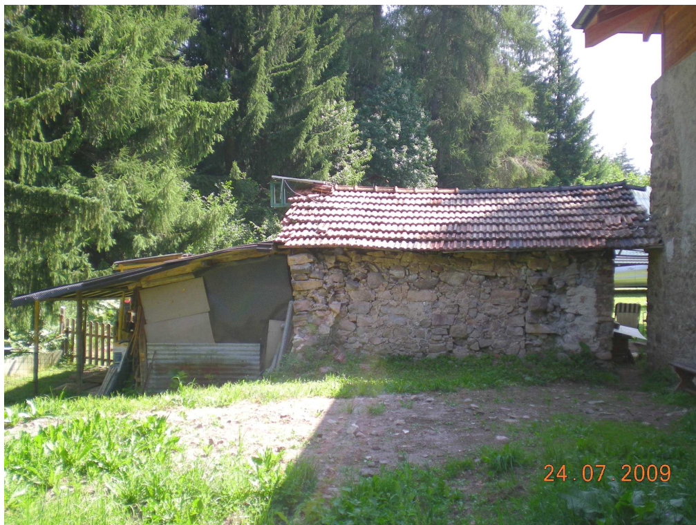
2. Prospetto ovest