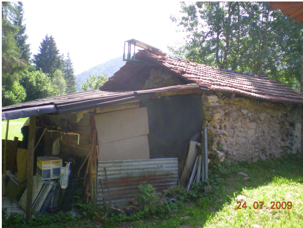
1. Prospetto nord