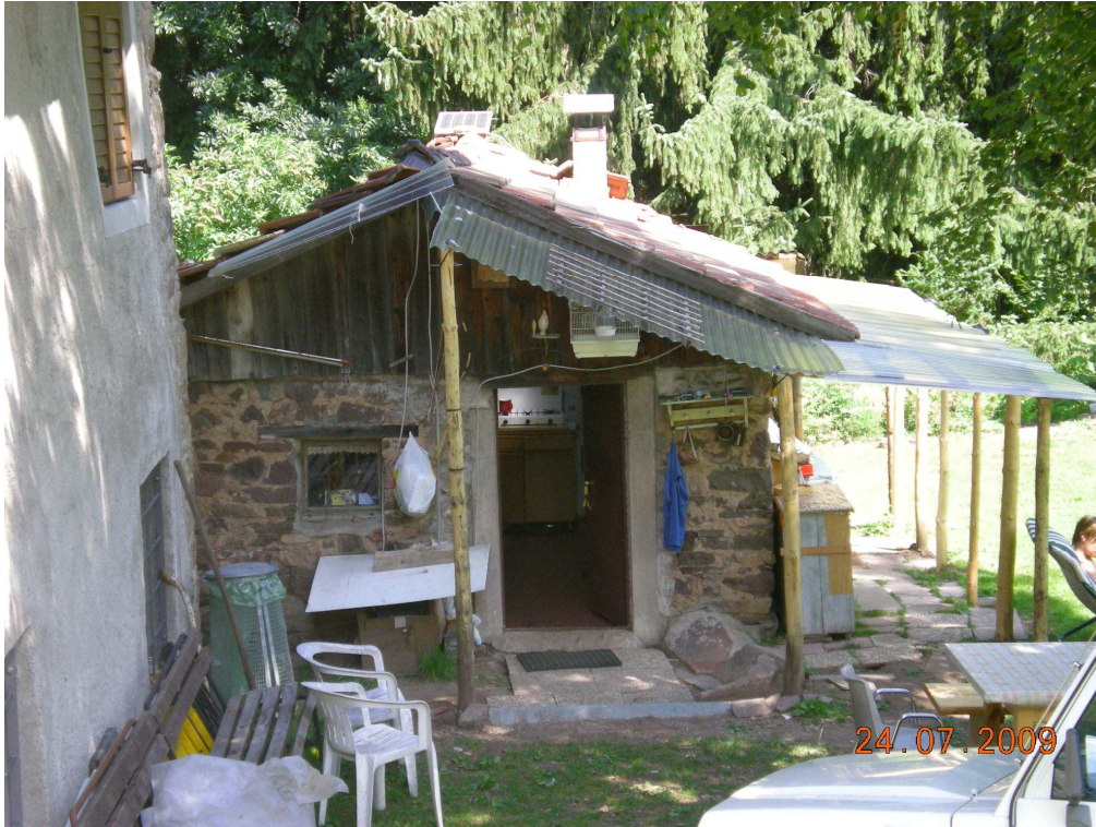
3. Prospetto sud