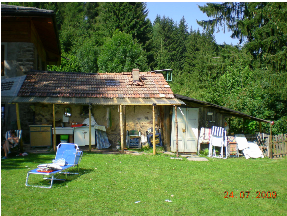
4. Prospetto est