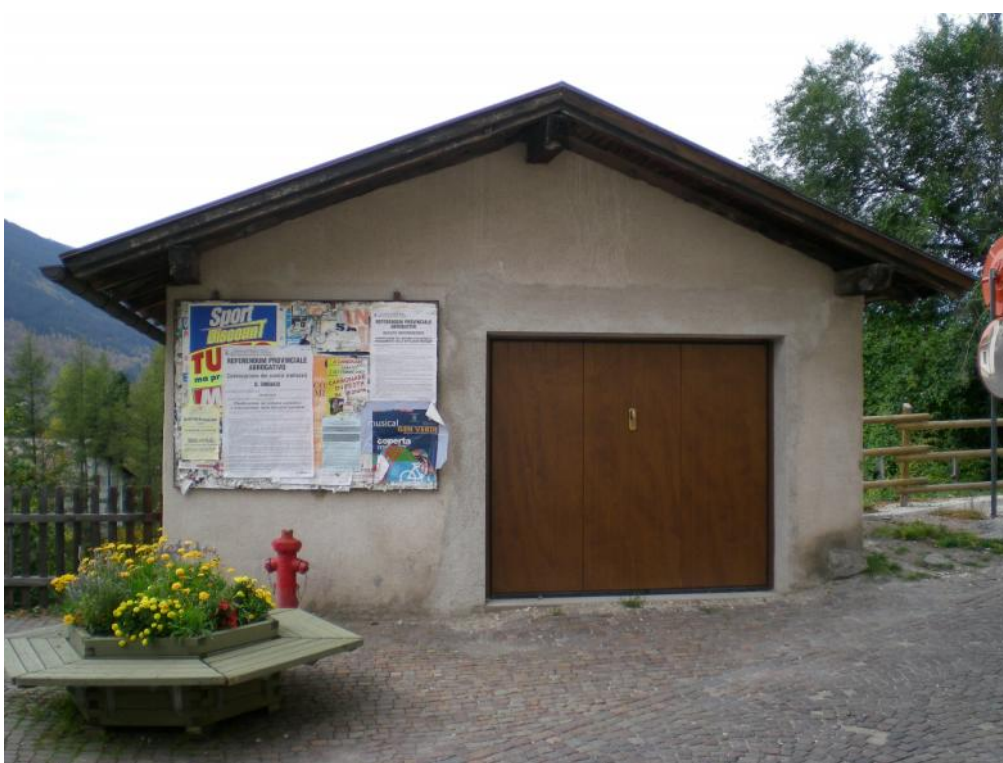
4. Prospetto est