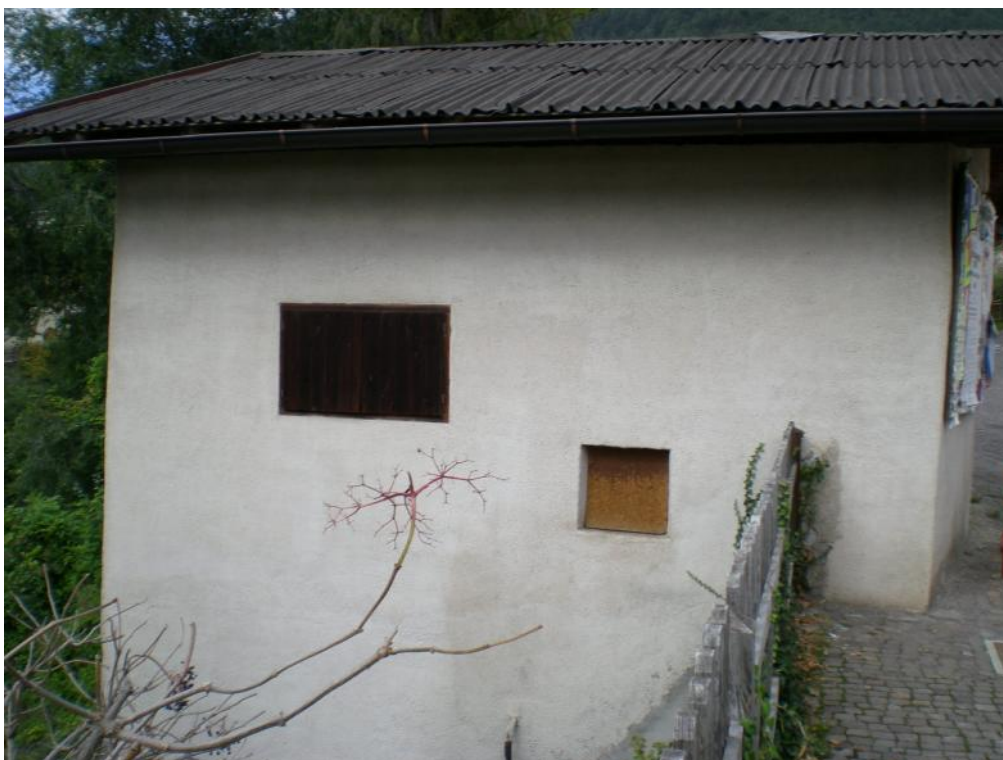
3. Prospetto sud