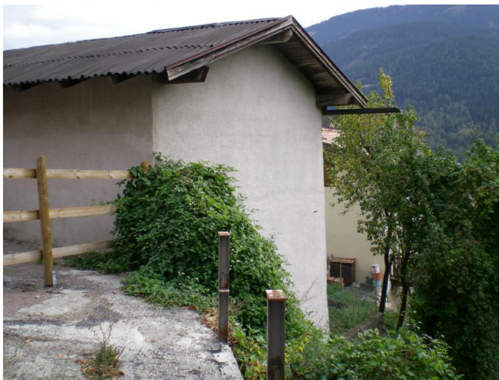
2. Prospetto ovest