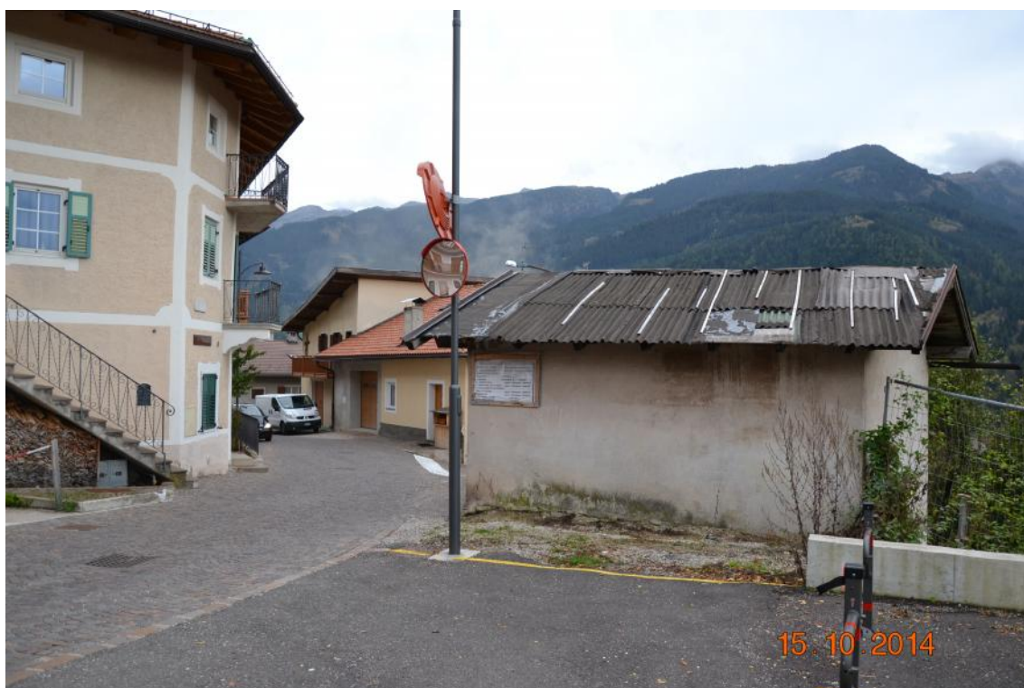
1. Prospetto nord